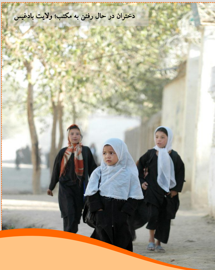
دختران در حال رفتن به مکتب؛ ولایت بادغیس

غذا در قبال تحصیل. این پروگرام با توزیع مواد غذایی سعی میکند که شاگردان را تشویق نماید تا در مکاتب حضور یابند. با انجام این پروگرام، فامیل ها تشویق میگردند تا اطفال خویش را به مکتب بفرستند و با دریافت این مواد غذایی به اقتصاد خانواده هایشان نیز کمک میگردد. تاکنون حدود 23,234 تن از شاگردان بی بضاعت بیش از 450 میلیون تن مواد غذایی دریافت نموده اند. این کار منجر به افزایش ثبت نام در مکاتب گردیده است.