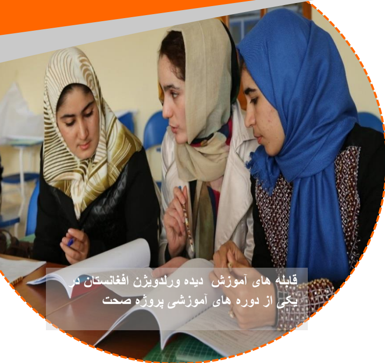
قابله های آموزش دیده ورلدویژن افغانستان در یکی از دوره های آموزشی پروژه صحت

از زنانی که در کار پرورش زنبور عسل هستند، قادر اند که بدون کمک دیگران هزینه های صحتی و تحصیلی اطفال خود را بپردازند.