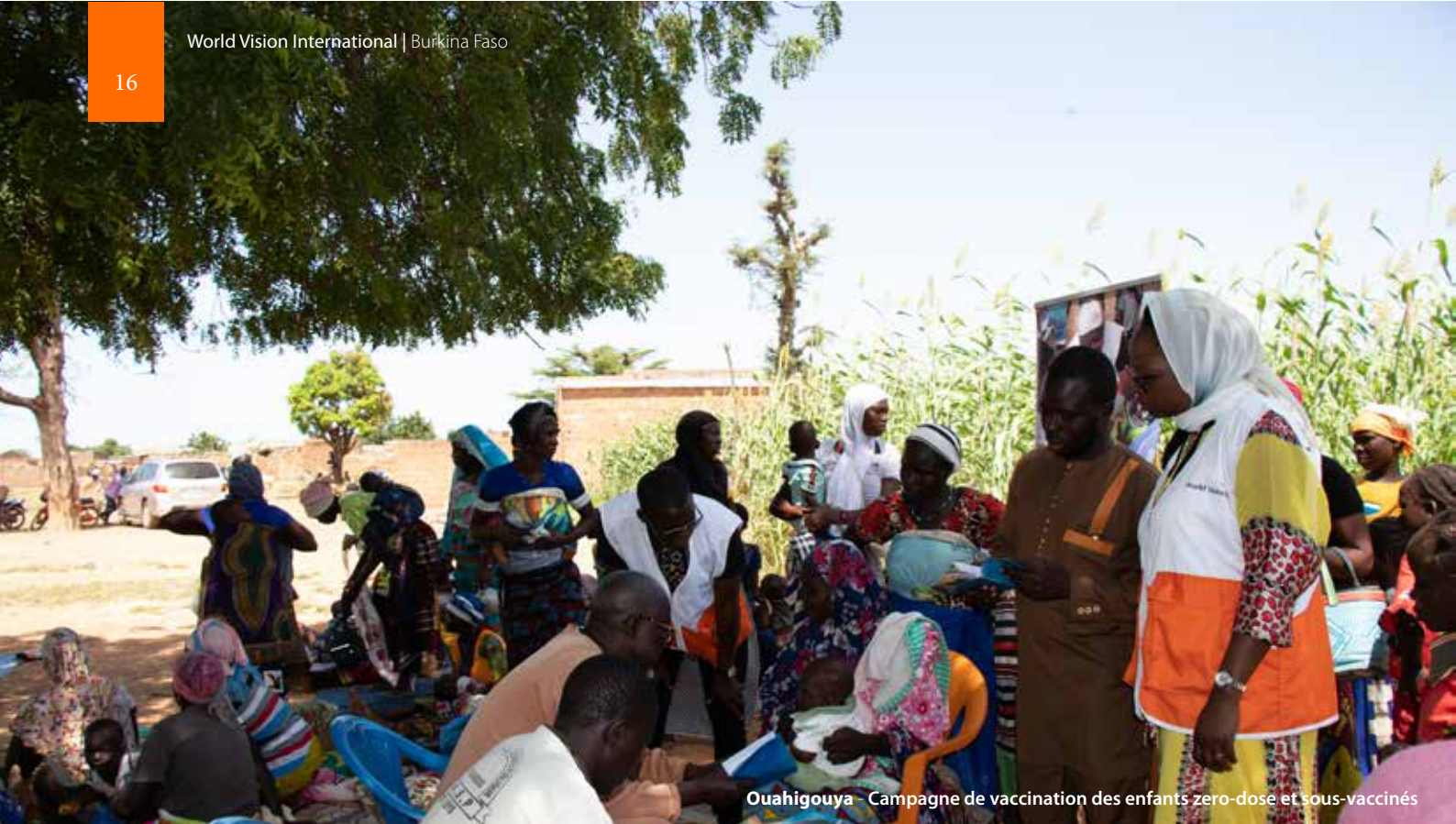
Ouahigouya - Campagne de vaccination des enfants zero-dose et sous-vaccinés