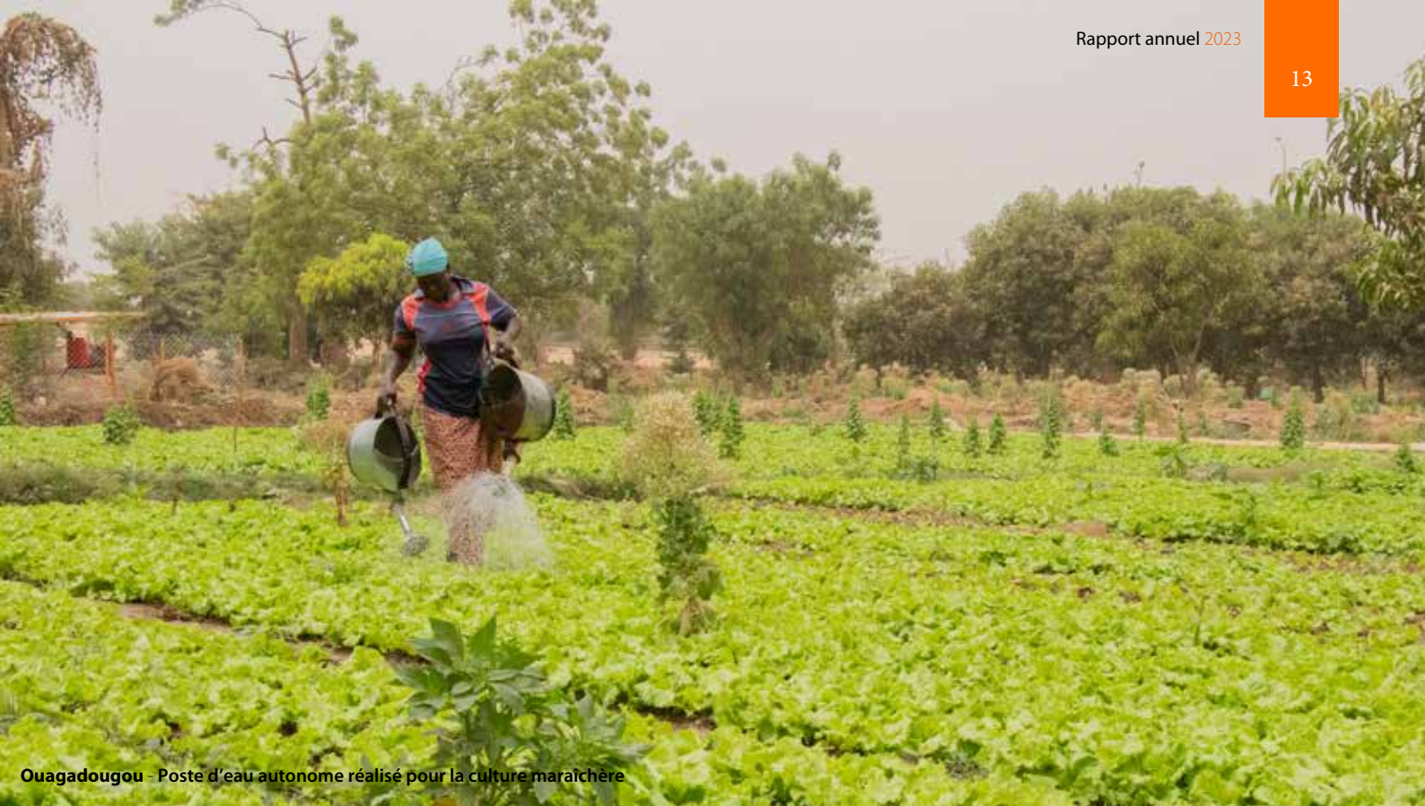
Ouagadougou - Poste d'eau autonome réalisé pour la culture maraîchère