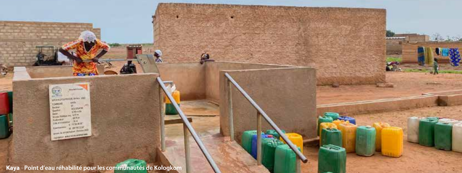
Kaya - Point d'eau réhabilité pour les communautés de Kologkom