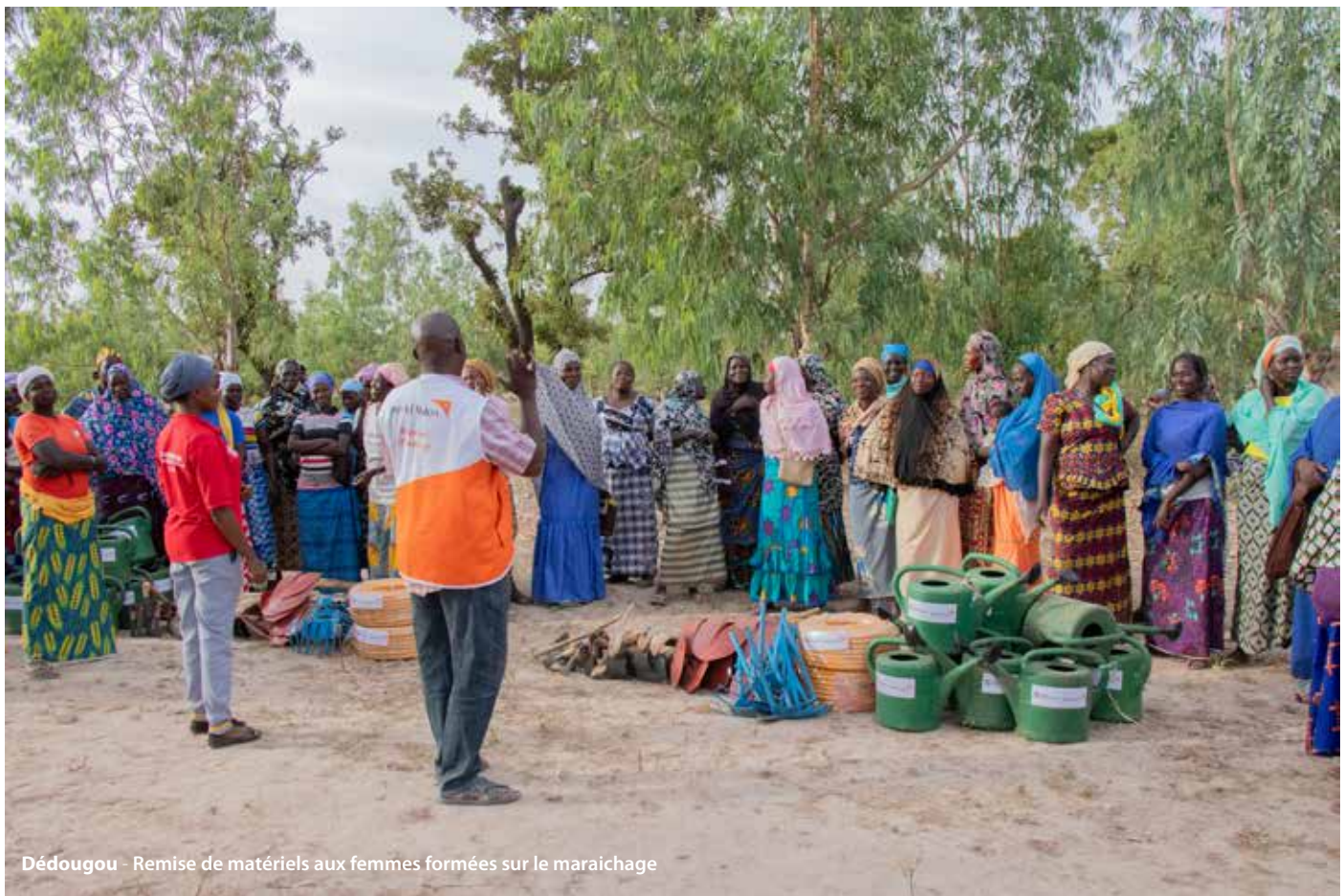
Dédougou - Remise de matériels aux femmes formées sur le maraichage