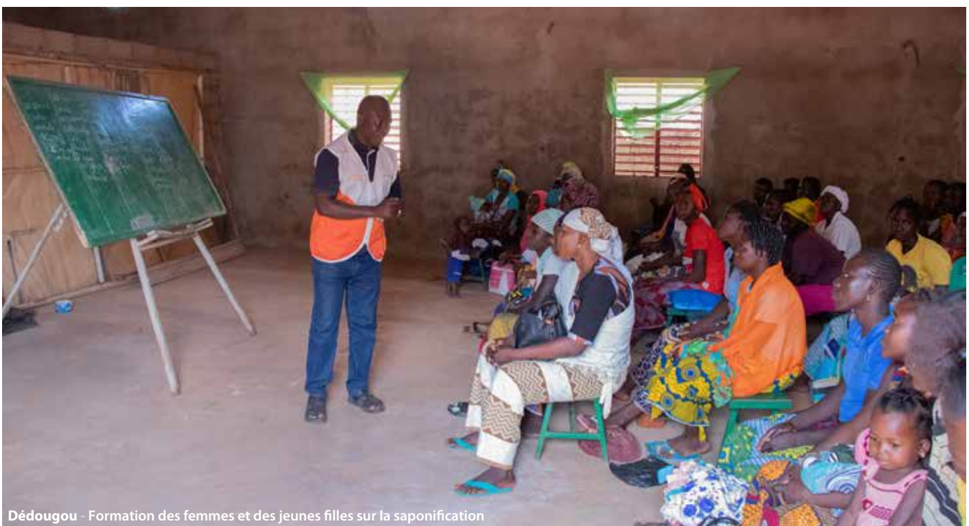
Dédougou - Formation des femmes et des jeunes filles sur la saponification