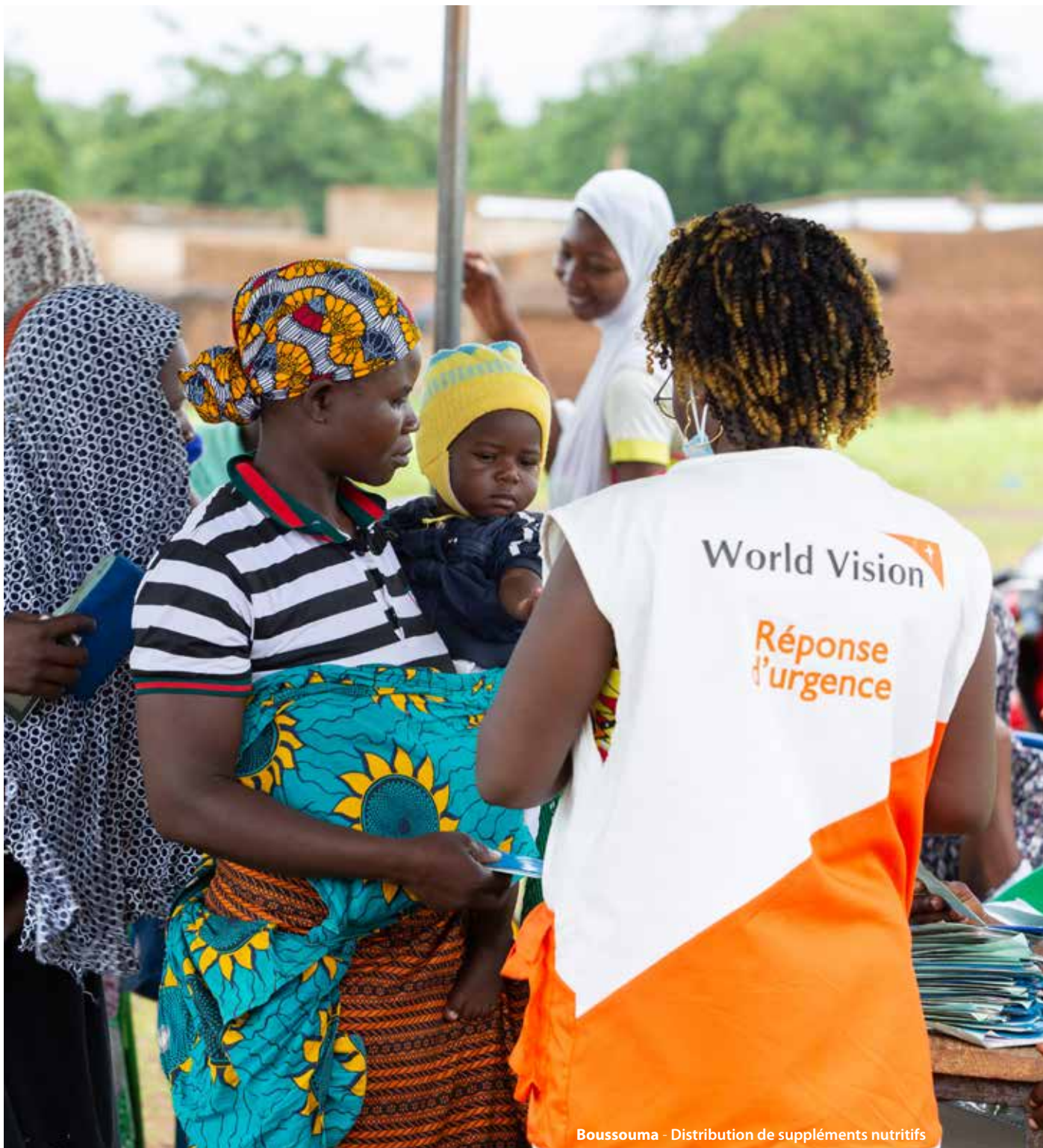
Boussouma - Distribution de suppléments nutritifs

75 593 adultes dont 28 525 hommes et 47 067 femmes