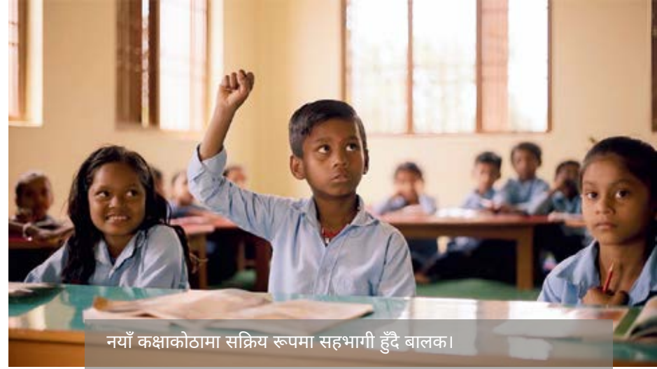
नयाँ कक्षाकोठामा सक्रिय रूपमा सहभागी हुँदै बालक।