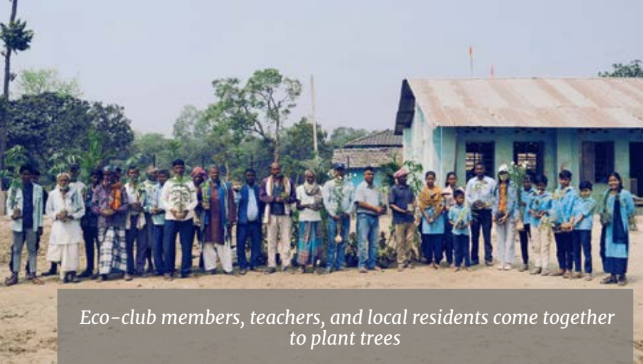
Eco-club members, teachers, and local residents come together to plant trees