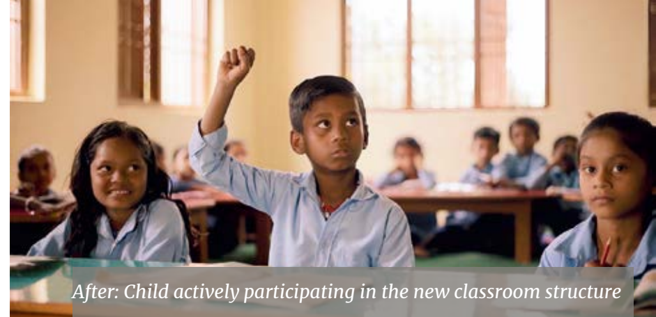
After: Child actively participating in the new classroom structure