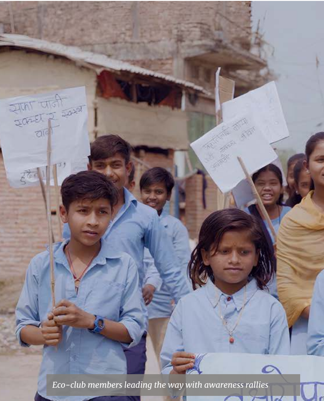
Eco-club members leading the way with awareness rallies