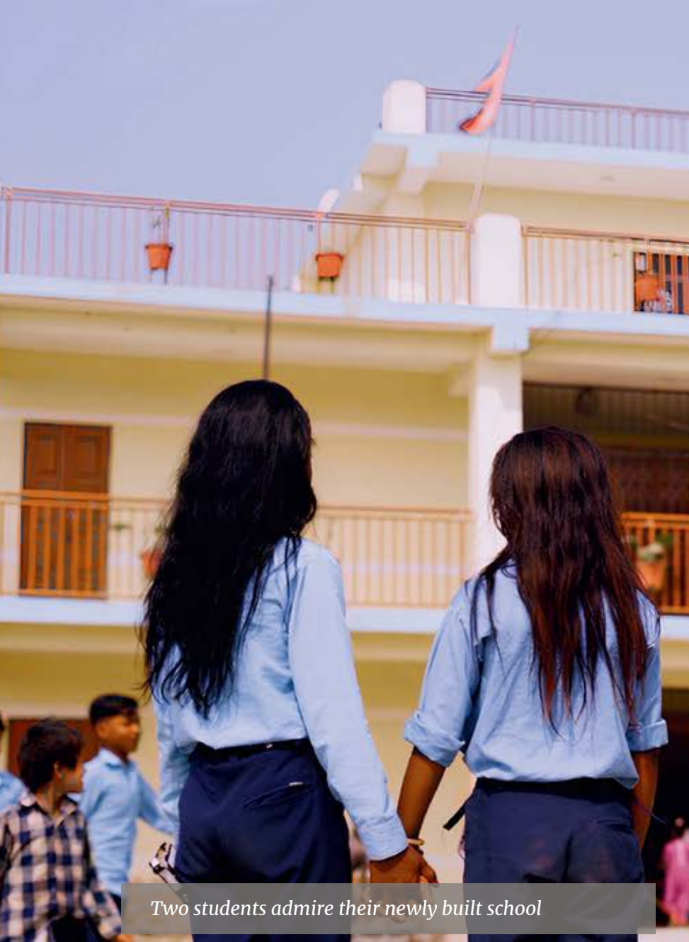
Two students admire their newly built school