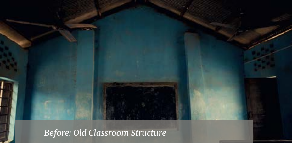
Before: Old Classroom Structure