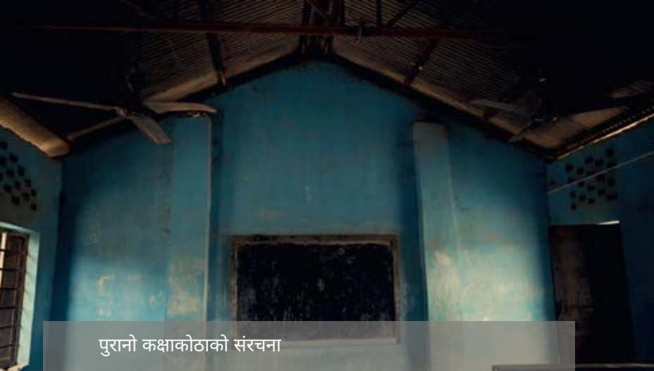
पुरानो कक्षाकोठाको संरचना