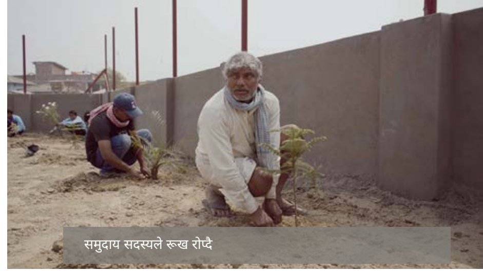
समुदाय सदस्यले रूख रोप्दै