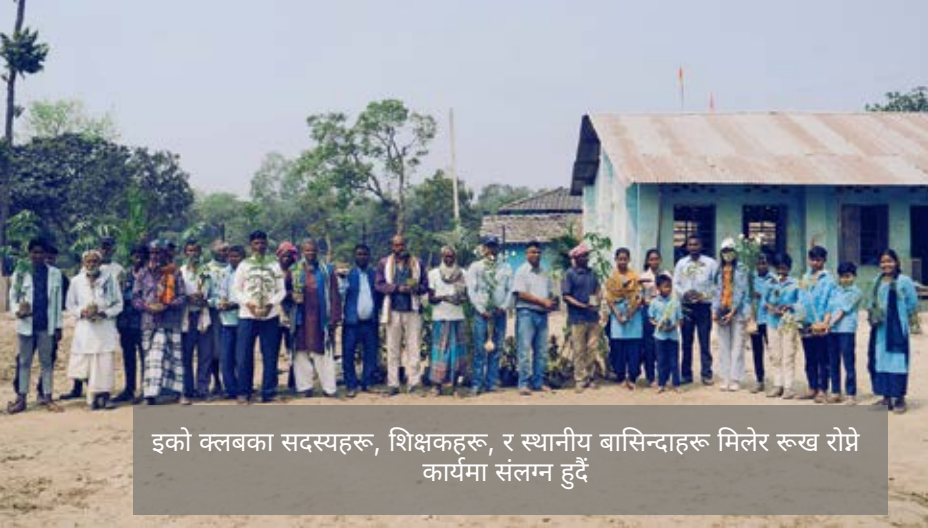
ईको क्लबका सदस्यहरू, शिक्षकहरू, र स्थानीय बासिन्दाहरू मिलेर रूख रोप्ने कार्यमा संलग्न हुदै