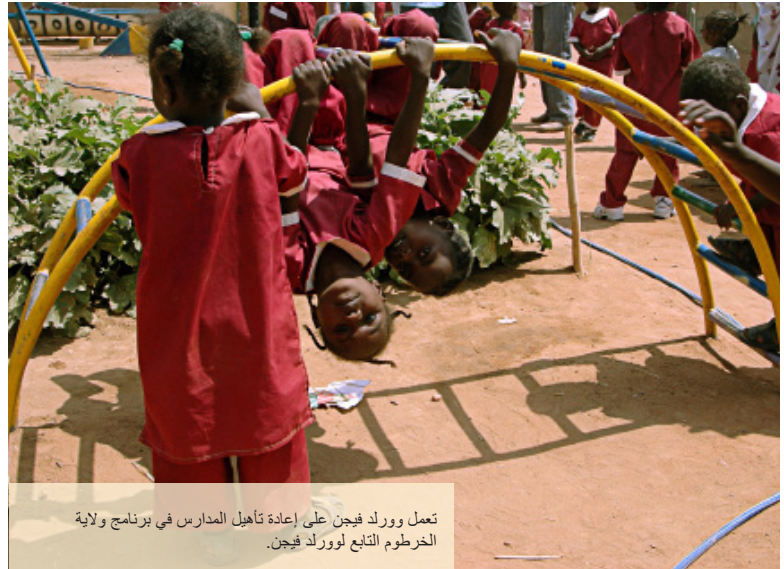
تعمل وورلد فيجن على إعادة تأهيل المدارس في برنامج ولاية الخرطوم التابع لورلد فيجن.

تتجه تدخلات التعليم في وورلد فيجن نحو مساعدة الفتيان والفتيات على اكتساب مهارات القراءة والكتابة والمهارات الحسابية والتعليم الأساسي الكامل. ولتحسين فرص الوصول إلى التعليم الجيد لجميع الأطفال، تعزز وورلد فيجن التعليم الصديق للطفل من خلال تعزيز بيئات التعلم عبر تحسين البنية التحتية في المدارس. كما ندعم تدريب المعلمين في التعليم في حالات الطوارئ ونقدم الدعم النفسي للأطفال. نحن أيضًا ندرّب جمعيات أولياء المعلمين على تعزيز نظام الدعم التعليمي برمته. نحن نعتقد أن دعم الحكومة في تعزيز قدرات التعليم الوطني يساهم في خلق تجربة تعليمية أكثر إيجابية.