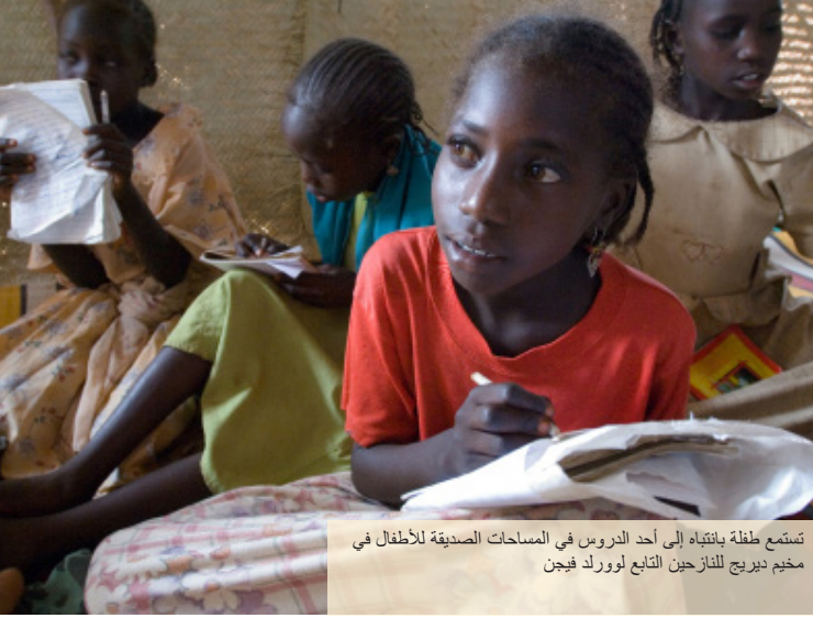
تستمع طفلة بانتباه إلى أحد الدروس في المساحات الصديقة للأطفال في مخيم ديريج للنازحين التابع لورلد فيجن

تعمل وورلد فيجن على ضمان عيش الأطفال في بيئة يتلقى فيها الأطفال الرعاية والاهتمام. تهدف برامجنا إلى منع والاستجابة إلى حالات الإساءة والإهمال والاستغلال والعنف ضد الأطفال والشباب، لضمان تلقيهم للرعاية والعيش في بيئة آمنة. نحن نوفر مساحات صديقة للأطفال في المخيمات، حيث يلعب فيها الأطفال ويشاركون في أنشطة رواية القصص والرقص والتعلم. تعد حملات التوعية بحقوق الطفل هي وسيلة أخرى نقوم من خلالها بمساعدة المجتمعات المحلية على بناء بيئة آمنة للأطفال.