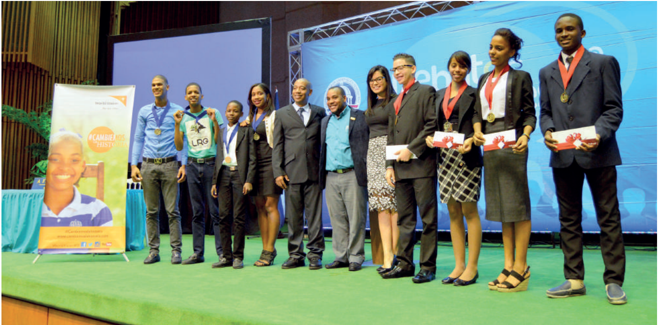
Los dos equipos que debatieron sobre el castigo físico contra niños y niñas./The two teams discussed about the corporal punishment of on children.