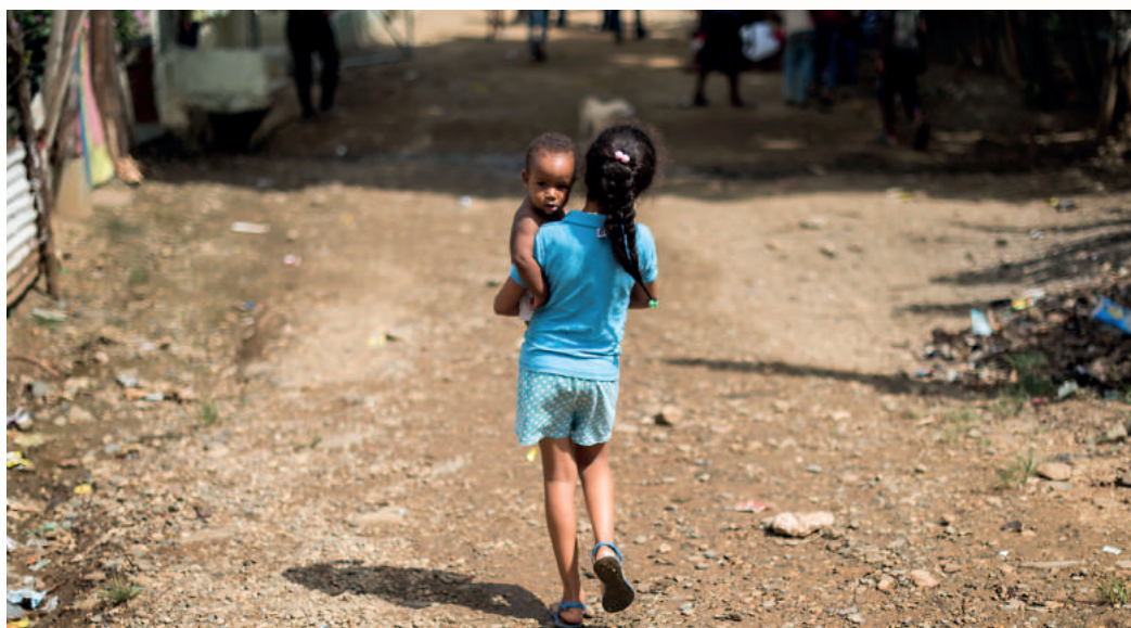
Imagen ganadora del XII Concurso Periodístico, en la categoría Fotografía, capturada por el fotoreportero de Diario Libre, Bayoan Freites./ This image by Bayoan Freites, photojournalist for Diario Libre won in the Photography Category of the XII Journalistic Competition

The Journalistic Competition on Children and Adolescents Issues has been held since 2004 to recognize the authors of the best journalistic works published during a year that deal with issues that contribute to denounce situations that affect children and adolescents and that promote the guarantee of their rights. The prize in each category includes a plaque of recognition by the three organizations and a money prize of RD $80,000. Mentions of honor receive a plaque of recognition.