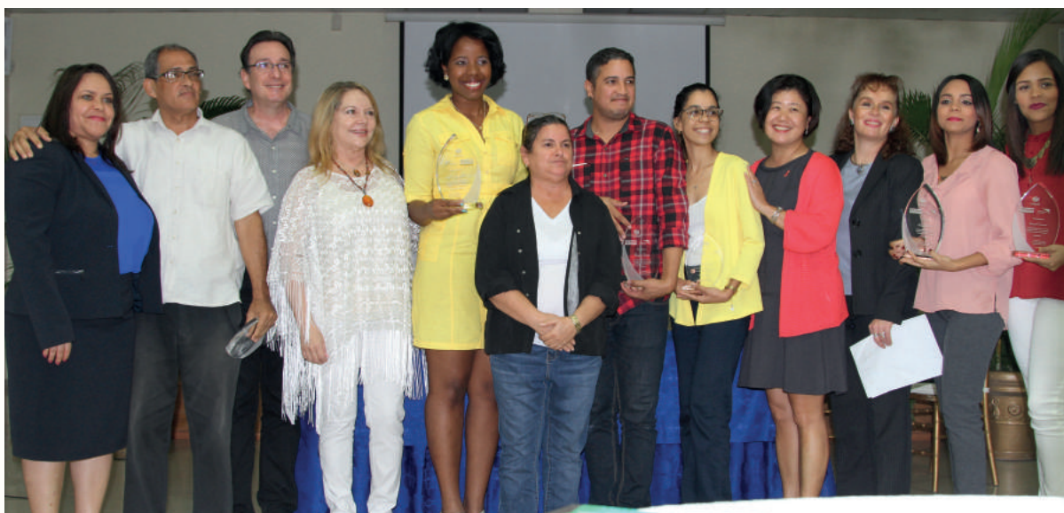
Acto de premiación del Concurso./ Awards ceremony.

El Concurso Periodístico sobre Temas de Niñez y Adolescencia se celebra desde 2004, para reconocer a los autores y autoras de los mejores trabajos periodísticos divulgados durante un año en los que se traten temas que contribuyan a la denuncia de situaciones que afectan a la niñez y la adolescencia y que promuevan la garantía de sus derechos. El premio en cada categoría incluye una placa de reconocimiento por las tres organizaciones y un premio metálico de RD$80,000. Las menciones de honor reciben una placa de reconocimiento.