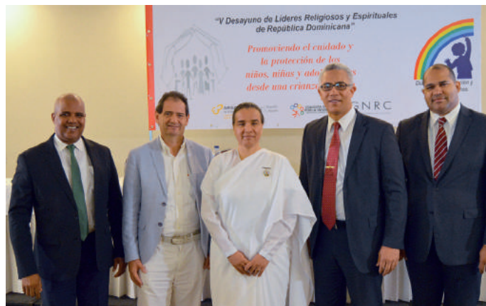
Líderes religiosos y espirituales que asistieron al encuentro./ Religious and spiritual leaders who attended the meeting.

Santo Domingo (22 de noviembre de 2016). - Líderes de distintas denominaciones religiosas y espirituales manifestaron preocupación por la cantidad de niños, niñas y adolescentes en el país que son víctimas de abuso y abandono, y que son marcados física y espiritualmente por el dolor de la violencia directa.