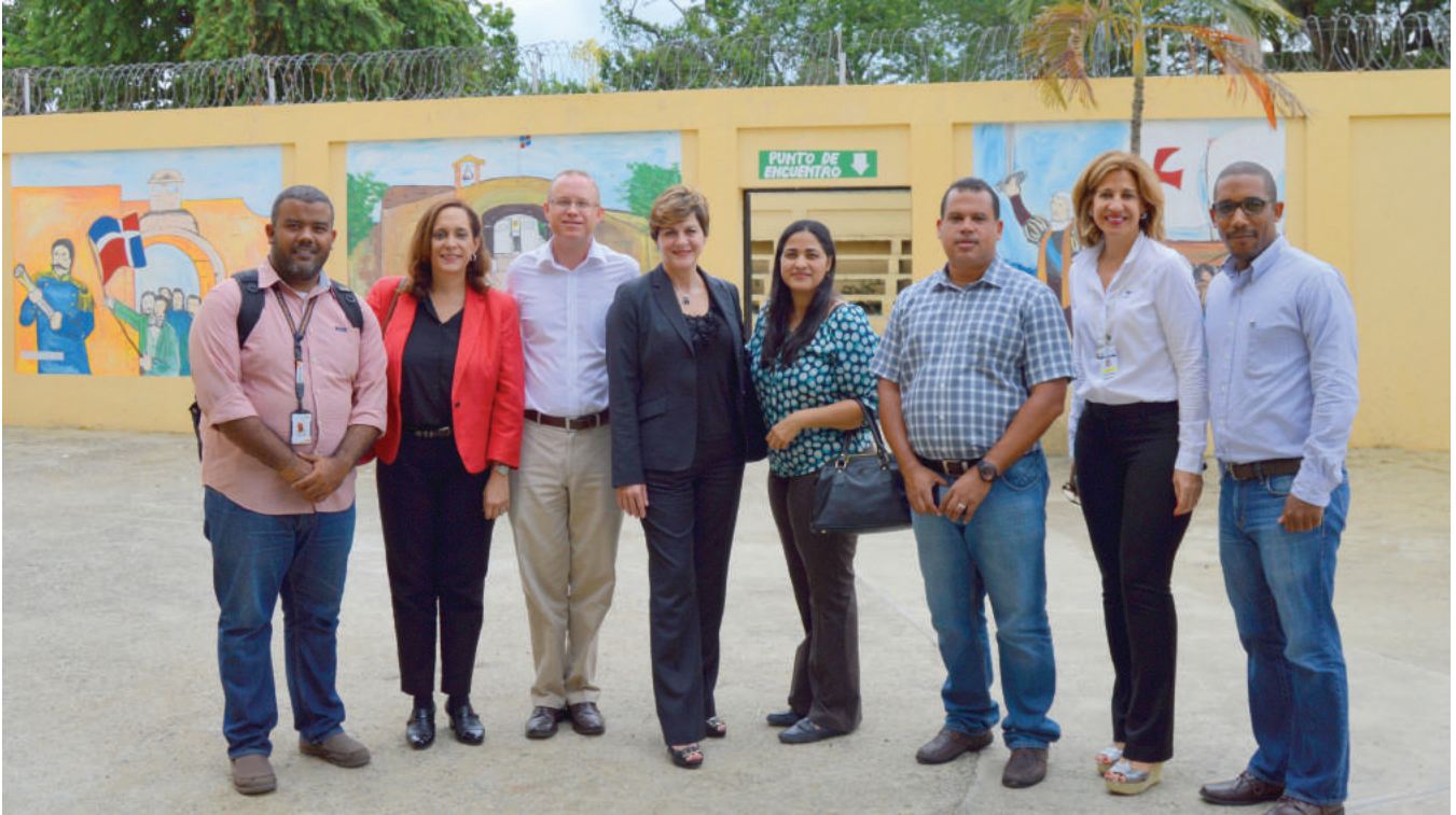
Miembros del Consejo Consultivo de World Vision junto a empleados de esa organización. Members of World Vision Advisory Board along with employees from that organization.