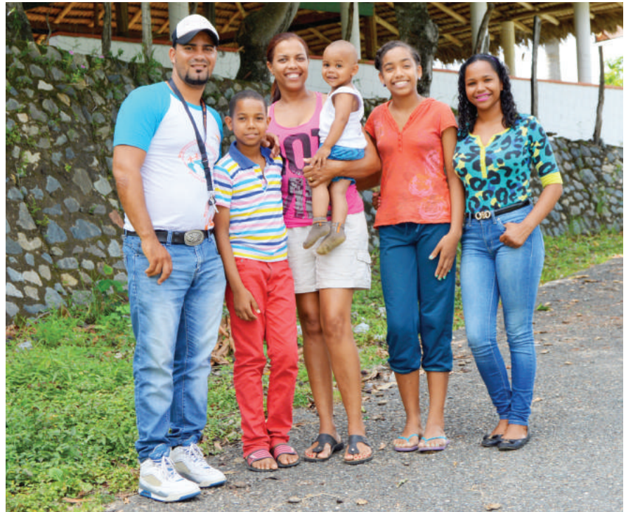
El Movimiento Infanto Juvenil Protagonistas es apoyado por World Vision e integra tanto a los jóvenes como a sus familias. The Protagonists Child and Youth Movement is supported by World Vision and integrates both young people and their families.

Children, adolescents and youth are grouped as the Protagonists Child and Youth Movement, a network supported