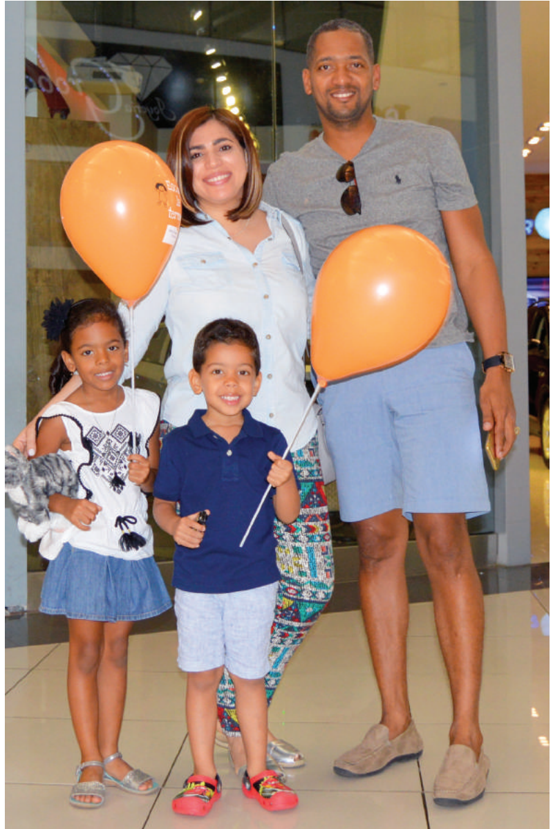
Decenas de familias participaron en el Día de la Ternura. Dozens of families participated in the Day of Tenderness.

During the event, which was held all day at the mall, dozens of families visiting the site participated in lectures, music, story-telling, drawings, face painting and they signed the Pact of Tenderness, a symbolic commitment to raising children free from all forms of abuse. ■