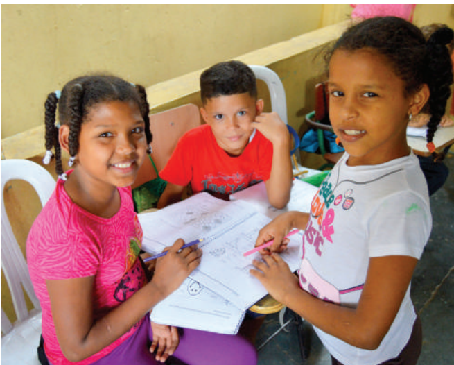
Estudiantes que participan del proyecto USAID Leer en la ciudad de Santiago de los Caballeros. Students participating in USAID Leer project in Santiago de los Caballeros.

Santiago de los Caballeros. - Un total de 200,000 estudiantes de primaria mejorarán sus habilidades de lectoescritura a través del proyecto USAID Leer, ejecutado por la Universidad Iberoamericana (UNIBE), en consorcio con World Vision, con fondos de la Agencia de los Estados Unidos para el Desarrollo Internacional (USAID).