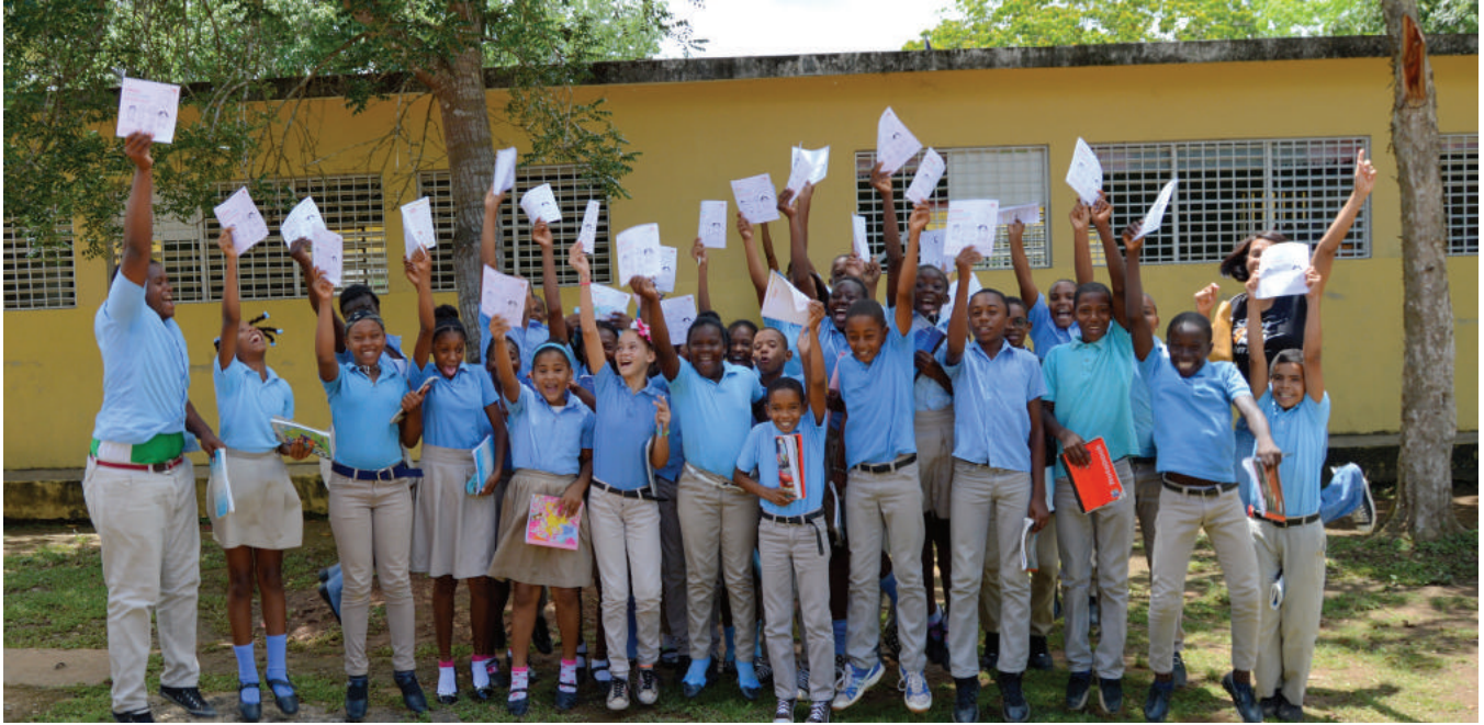
Una parte de los niños y las niñas capacitados en derechos de la infancia. Some of the children trained in children's rights.