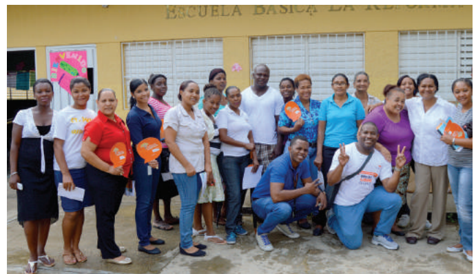
Algunos de los padres, madres, tutores y docentes formados en crianza de la infancia con ternura. Some of the parents, guardians and teachers trained on raising children with tenderness.