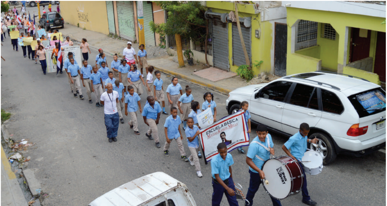
Marcha en Haina. March in Haina municipality.