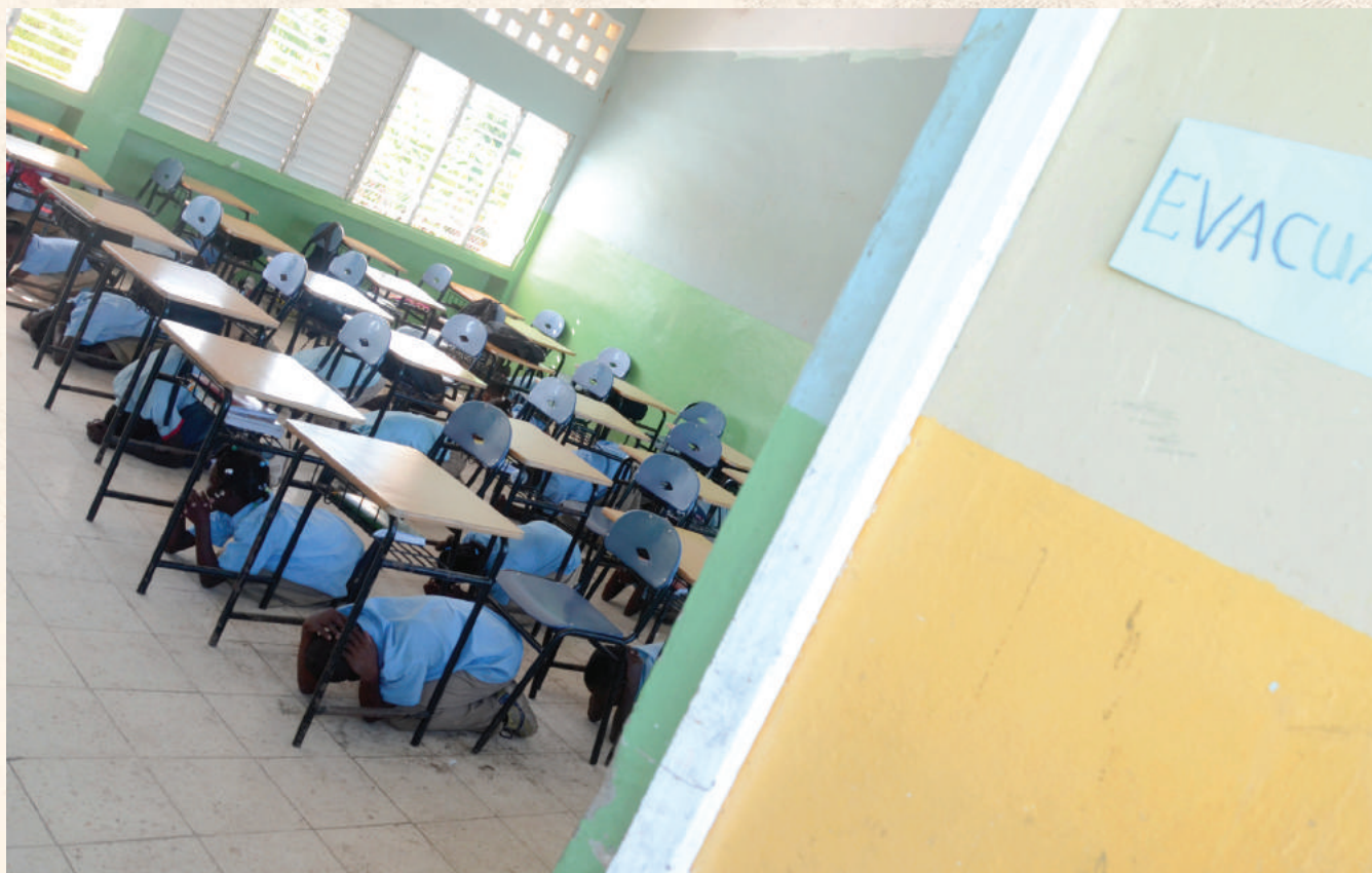
Niños y niñas de la Escuela Básica Rafael Tomás, de batey Cuchilla, durante un simulacro frente a un sismo. Children from the Primary School Rafael Thomas, in the southwest of the Dominican Republic, during a drill against an earthquake.