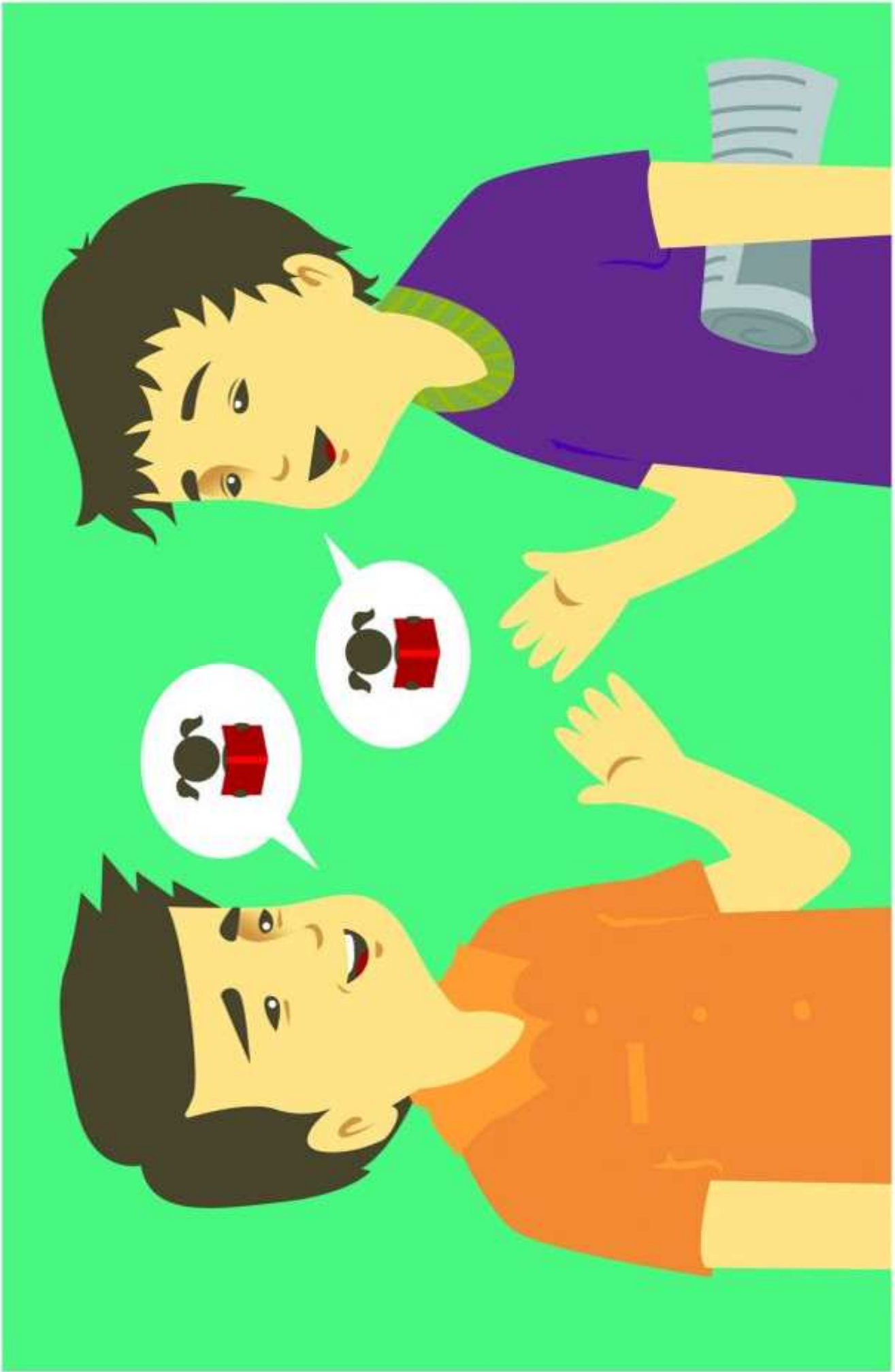
ကောင်းစွာနားထောင်သောလူများသည် (၃) သူများပြောပြီးသည့်အရာများကို ကိုယ့်စကားနှင့်ကိုယ် ပြန်ပြောသည်။